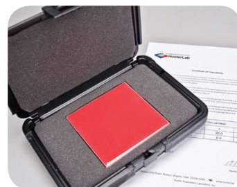
HunterLab azulejo de tomate

... todo respaldado por el soporte más exclusivo de la industria